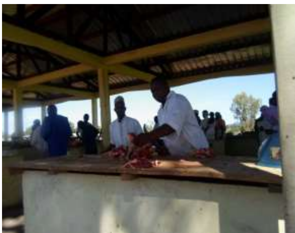
Figure 8 : marché de viande à Touboro

La filière viande est en cours d'organisation. Les hangars bien élaborés ont été construit par la Commune (voir photo cidessous). Cependant, le marché à bétail et le lieu d'abattage reste à construire pour assainir totalement cette filière.