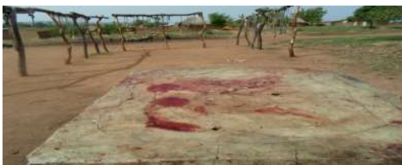
Figure 9 : aire d'abattage à Touboro