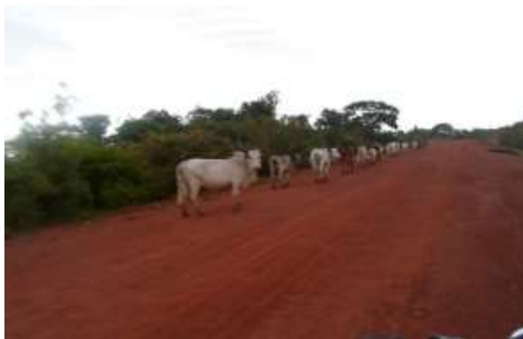
Figure 5 : bovins à Touboro

La filière viande est en cours d'organisation. Les hangars bien élaborés ont été construit par la Commune (voir photo cidessous). Cependant, le marché à bétail et le lieu d'abattage reste à construire pour assainir totalement cette filière.