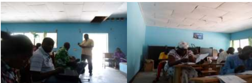
Figure 1 : séance de restitution de formation dans la salle de délibération de la commune de Touboro

L'exposé sur le DIC était survenu le 23/05/2013. La méthodologie de mise en œuvre du DIC a été présentée au Participant. L'exposé s'est attardé sur les différentes fiches de collecte de données. Le facilitateur s'est suffisamment attardé sur le mode d'utilisation et de remplissage de chaque fiche.