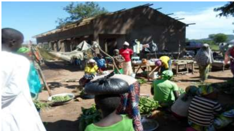
Figure 4 : une vue du marché des légumes à Touboro

périodes de travaux champêtres, le reste de temps est valorisé pour mener d'autres activités productives.