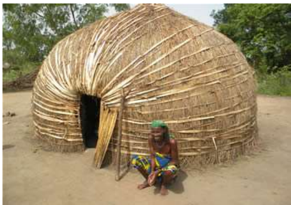
Figure 6 : case Bororo à Touboro