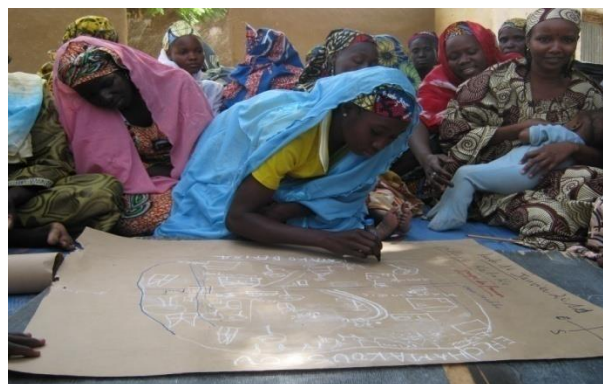
Photo 2: Matérialisation de la carte du village par un groupe de femme