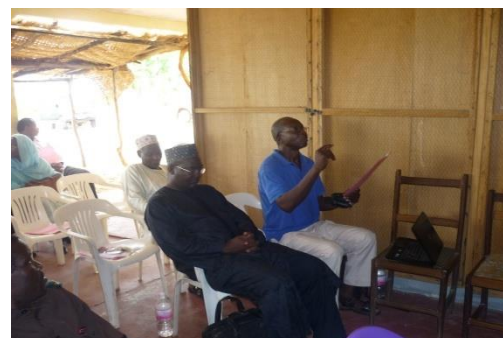
Photo 4: Une intervention énergique du chargé de formation du PNDP Nord lors de l'atelier de la mobilisation des ressources

L'atelier de mobilisation des ressources a concerné ceux des sectoriels dont le transfert des compétences est déjà effectif, les partenaires au développement, les élites et tout autre personne pouvant être d'une utilité quelconque à la commune. Il était question ici d'apprécier le niveau des ressources pouvant être mobilisées, afin de permettre à la commune d'avoir une vision objective tant financière que matérielle et humaine pouvant aider celle-ci à ne programmer que les actions susceptibles d'être réalisées et/ou ayant déjà des fonds disponibles.