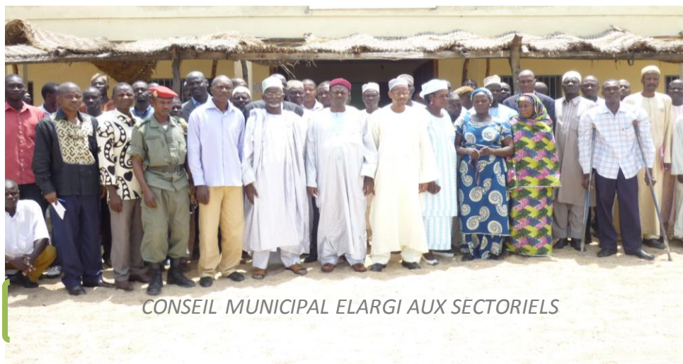
CONSEIL MUNICIPAL ELARGI AUX SECTORIELS