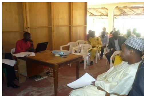
Photo 3: Assiduité du sous-préfet de Baschéo et des sectoriels lors de l'atelier de validation des cadres logiques

Dans le but de déterminer une logique d'intervention à toutes les actions qui seront menées, Les cadres logiques ont été élaborés par l'équipe des facilitateurs après exploitation des différents diagnostics. A cet effet, tous les secteurs ont été pris en compte et les cadres ont été remis à chaque sectoriel pour analyse et appréciation suivant la logique des normes sectoriels. Ces sectoriels ont été invités à l'atelier de validation de ces cadres logiques ; ont apporté si possible des amendements qui ont été intégrés pour certains séance tenante, pour les autres l'équipe des facilitateurs les a intégrés ultérieurement. Ces amendements ont été soumis pour une deuxième fois aux sectoriels pour confirmation.