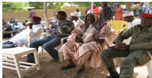
Photo 1: Une vue des autorités présentes lors des activités de lancement